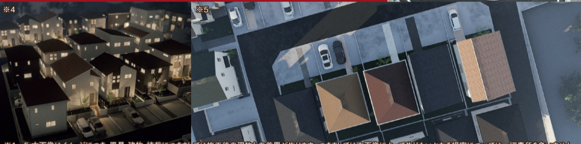
※1~5 本画像はイメージにつき、風景・建物・植栽につきましては施工後の現物との差異が生じます。つきましては本画像によって生じたいかなる損害については一切責任を負いません。